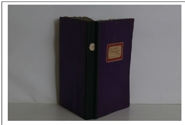
A kötet restaurálás előtt és után

A 1344 jelzetű, Gamauf Gottlieb Teofil: Dokumente zur Oedenburger Kirchengeschichte II. kötet I. rész kéziratos kötet restaurálása a fotódokumentáció elkészítésével kezdődött. A kötetet fertőtlenítettük. A portalanítás és óvatos száraz tisztítás után a lapszámozás ellenőrzésével a kötetet még mindig elszívóban szétbontottuk. A különböző tinták oldékonyságát ellenőriztük. A lappárokat mostuk, savtalanítottuk és utántenyeztük. Egy helyen ismeretlen eredetű maró anyag került a kötetbe a lapokat összeragasztva, amit igyekeztünk szétválasztani. A lapokon jól látszik a maró anyag hatására a tinták halványodása. A közvetlen oldalakon sajnos már a papír is szétmaródott. A javításokat kézi javítással végeztük japán papír, merített papír és glutofix használatával. A marás okozta nagyobb hiányokat papíröntéssel egészítettük ki, amihez papírpépet, krétát és tylose-keményítő keverékéből készített utántenyező anyagot használtunk. A hiányzó előzők részeket savmentes rongy ingres papírral pótoltuk. Az eredeti technika szerint szalagra fűztük fel az íveket. A kötetet rekonstruáltuk: régi típusú egészpapír kötetést készítettünk. A táblán lévő címke visszakerült a táblára. Fotódokumentációt készítettünk a restaurálás utáni állapotról. A kötetet Gy.Molnár Kerstin restaurálta.